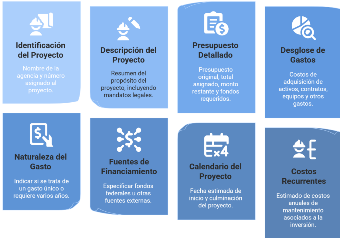
Figura 4.3-a. Información del Plan de Gasto de Capital